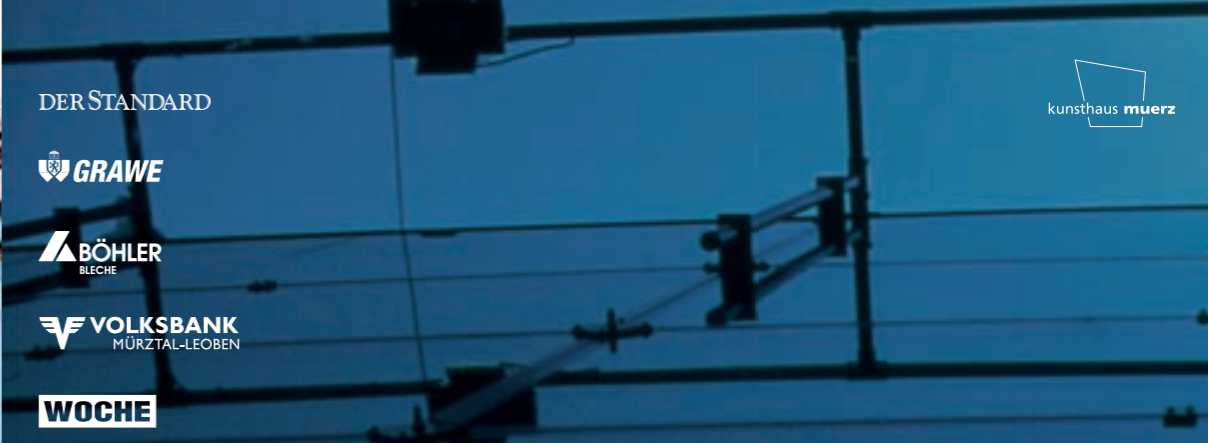
vorschau brücken in die gegenwart 3. teil