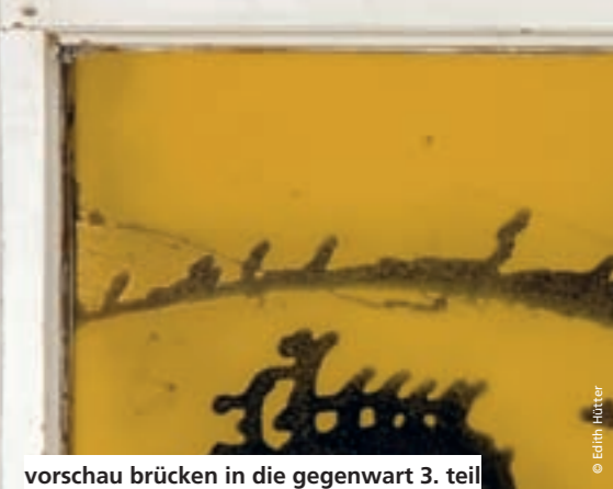
vorschau brücken in die gegenwart 3. teil